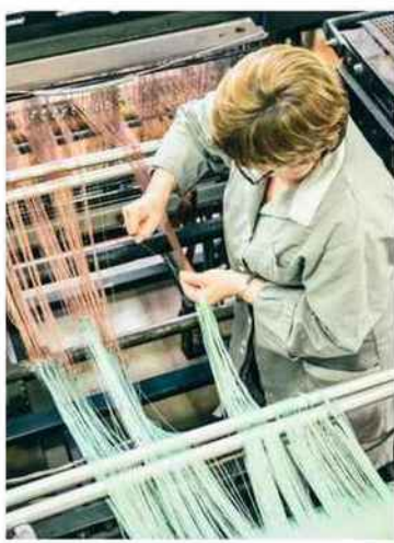
Aucun processus automatisé ne peut remplacer l'expertise des huit tisseuses.