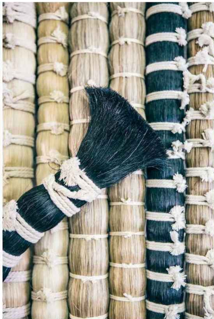
Le crin arrive de Mongolie sous forme de panaches, de longs paquets de fibre brute aux teintes naturelles qui ont été ficelés à la main.