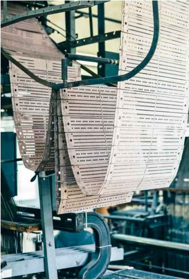
Les métiers fonctionnent avec des cartes perforées créées sur mesure et réalisées à la main, qui permettent le tissage des motifs.