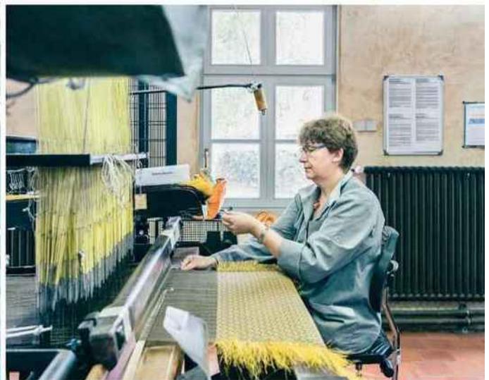
La teinture est confiée à un sous-traitant suivant la palette de la maison (en haut). Il faut entre un et deux ans de pratique pour tisser en toute autonomie (ci-dessus).

→ sur ces métiers, il faut à chaque tisseuse entre un et deux ans de pratique, afin d'acquérir la précision nécessaire.