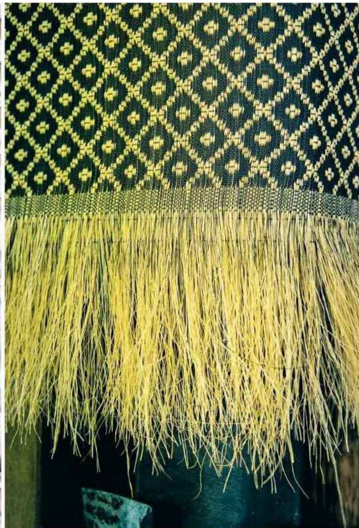
L'entreprise sarthoise propose 48 modèles de tissus d'ameublement, qui séduisent les clients les plus exigeants : hôtels de luxe, musées... jusqu'au palais de l'Elysée.

synthétiques (Lurex...). La rapidité et une technique exemplaire ne suffisent pas, il faut aussi avoir un œil de lynx ! En effet, le crin n'a ni la même épaisseur ni exactement la même couleur à chacune de ses extrémités. On doit donc en alterner le sens pour obtenir une étoffe d'une parfaite régularité.